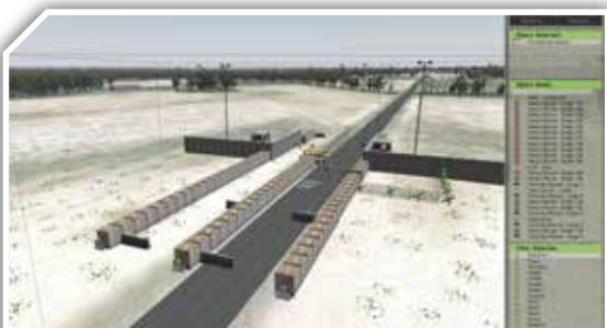
Checkpointbau in bestehender Szenerie

Der virtuelle Sandkasten zielt auf den Auszubildenden in einer klassischen Lehrsaalsituation. Ausbildungsinhalte sind beispielsweise der Aufbau von Feldlagern, Checkpoints, Feuerstellungen oder Beobachtungsposten.