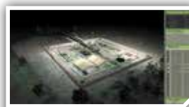
Tag / Nachtwechsel

Durch den hohen Realismusgrad der Simulation wird der Trainingserfolg wesentlich gegenüber klassischen Ausbildungen wie mit Papier und Stift oder am klassischen Sandkasten erheblich gesteigert.